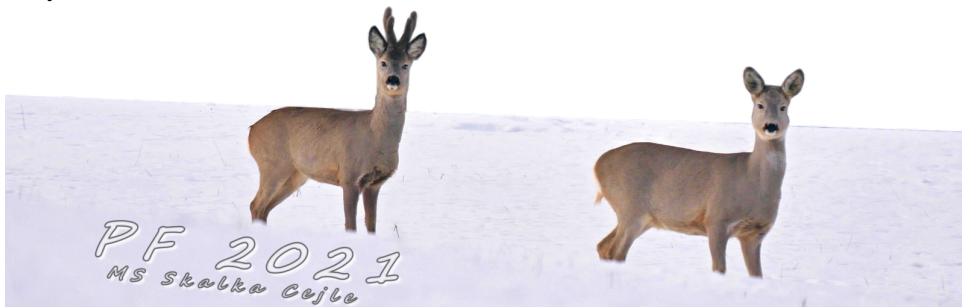
Myslivecký spolek Skalka Cejle

Chceme zároveň poděkovat za Vaši přízeň, za ohleduplné chování Vás všech právě k naší přírodě, všech, kteří si uvědomují, jak je ona v této době pro nás cenná a jak i ona to kvůli nám nemá v těchto časech jednoduché. Současně děkujeme vedení obce za podporu naší činnosti a těšíme se i v příštím roce na dobrou spolupráci, podobně jako byla realizována letos.