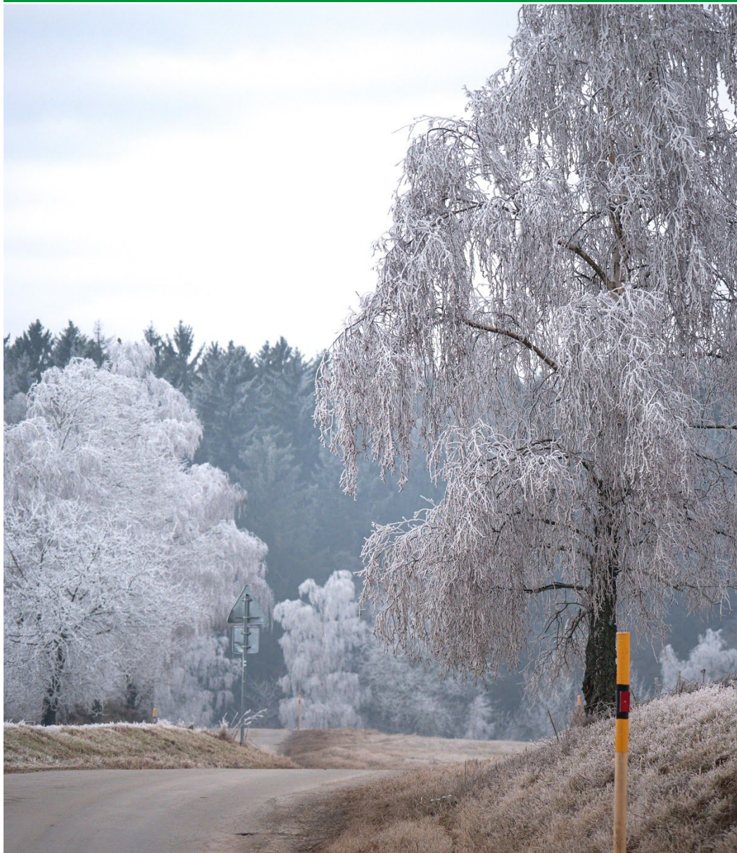
“Zimní cestou”